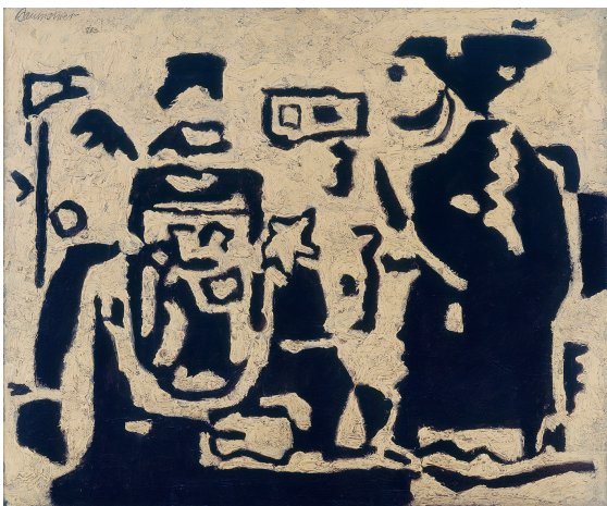
Turandot , 1944/46 Öl mit Kunstharz und Spachtelkitt auf Hartfaserplatte 54 x 65 cm sign. o. l.: Baumeister Beye/Baumeister WV Nr. 1243