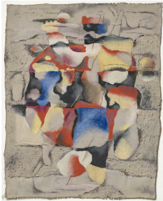
Ballspieler im Kreis , 1935 Öl und Sand auf Leinwand 53 x 42 cm Beye/Baumeister WV Nr. 567