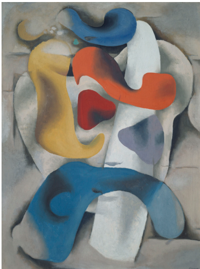
Figur in Bewegung , 1936/37 Öl auf Leinwand 130 x 97 cm sign. u. r.: Baumeister Beye/Baumeister 671