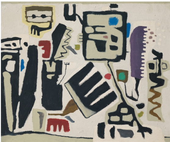
Pfefferfresser , 1950 Öl mit Kunstharz und Spachtelkitt auf Hartfaserplatte 54 x 65 cm sign. o. r.: Baumeister Beye/Baumeister WV Nr. 1029

Ausgestellt 1955 auf der Documenta I in Kassel, Kat. Nr. 29.