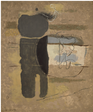
Tennisspieler , 1934/35 Öl auf Karton 55 x 46,5 cm sign. u. l.: Baumeister Beye/Baumeister WV Nr. 544