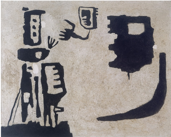
Afrikanische Geister , 1949 Öl mit Kunstharz und Spachtelkitt auf Hartfaserplatte 65 x 81 cm verso betitelt, dat. u. sign.: Afrikanische Geister 1949 65 x 81 Baumeister Beye/Baumeister WV Nr. 1020

Ausgestellt 1955 auf der Documenta I in Kassel, Kat. Nr. 29.